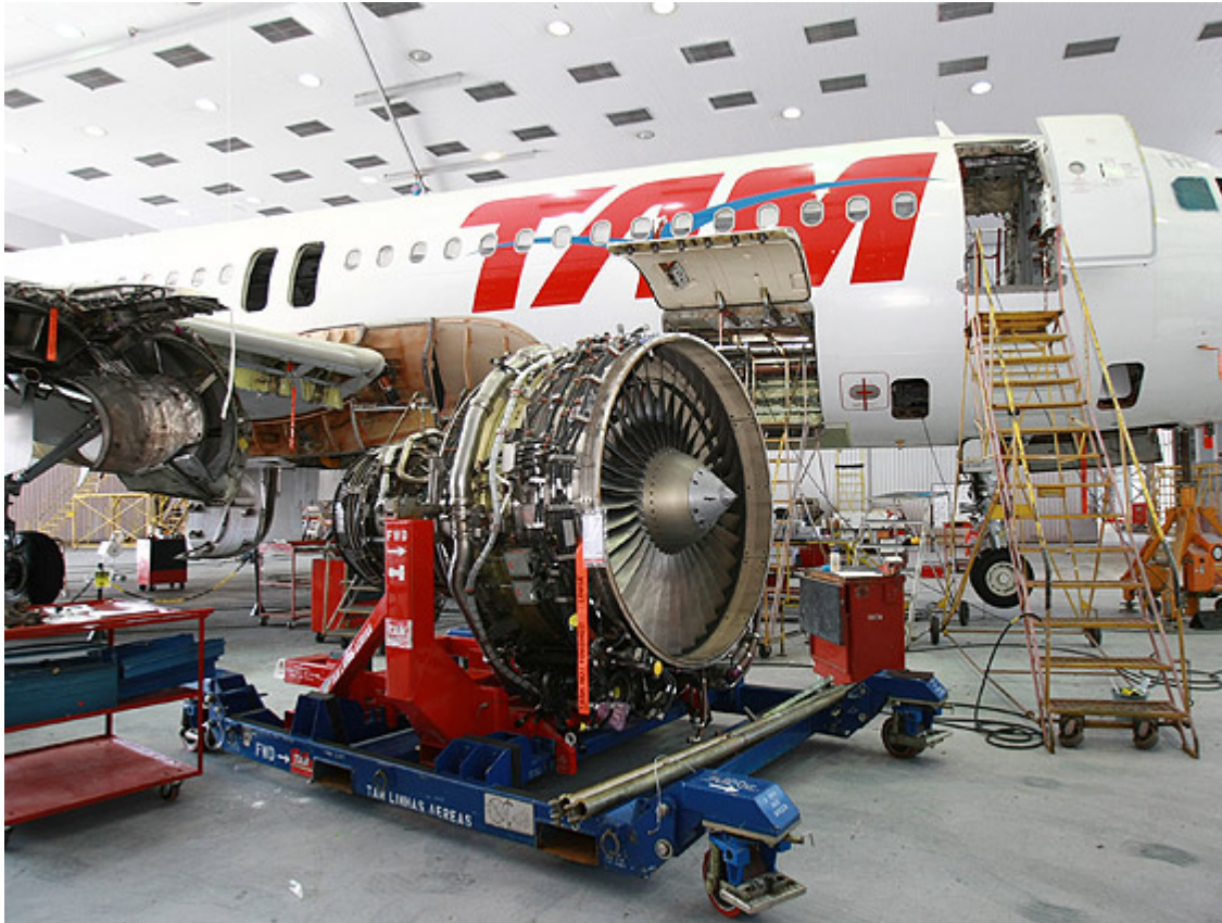
Avião passa por manutenção em unidade da TAM em São Carlos, cidade que está tendo um boom no setor aeronáutico

Segundo a TAM, a internacionalização vai duplicar a capacidade de atendimento do centro de manutenção em São Carlos. Isso significa R$ 50 milhões em investimentos e mais 600 empregos na área.